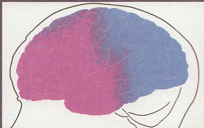
Négy kezelés után