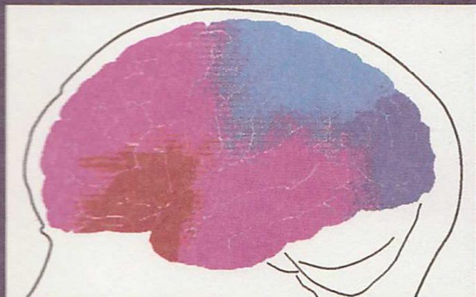
Súlyos generalizált szorongás a kezelések előtt